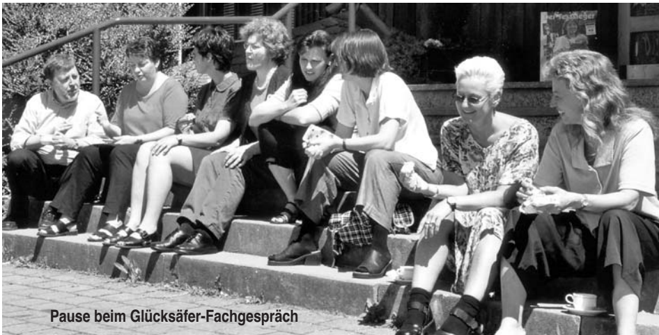
Pause beim Glücksäfer-Fachgespräch