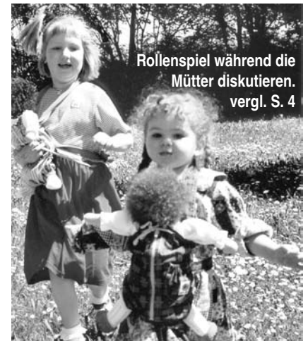
Rollenspiel während die Mütter diskutieren. vergl. S. 4

Wenn wir Fachleute uns die Zeit nehmen, Eltern behilflich zu sein, die Sprache ihres Kindes seinem Alter und seiner Individualität entsprechend zu verstehen, dann geben wir ihnen Halt. Dann machen wir sie sicherer in ihrem Gefühl, im Umgang, im Grenzen setzen und Loslassen mit ihrem Kind, das sie ins Leben begleiten.